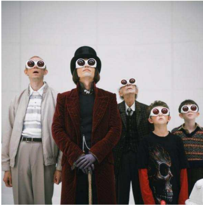
Willy Wonka .