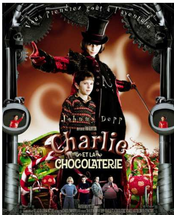
Film Charlie et la chocolaterie .