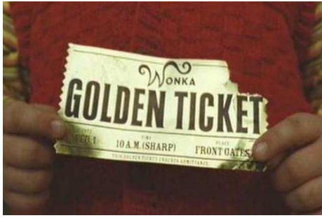
Ticket d'or .